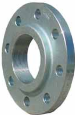
DRAADFLENZEN STAAL DIN 2566 /EN 1092-1(13) ST37 VERZINKT - 16 BAR -

Topkwaliteit voor een breed scala aan toepassingen binnen de chemische en petrochemische industrie, offshore, etc. Naast dit assortiment van meest toegepaste flenzen zijn een groot aantal types en maten op aanvraag leverbaar.