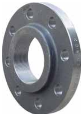
DRAADFLENZEN STAAL DIN 2566/EN 1092-1(13) ST37 ZWART - 16 BAR -